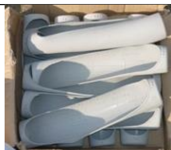
スティックカバー 10枚