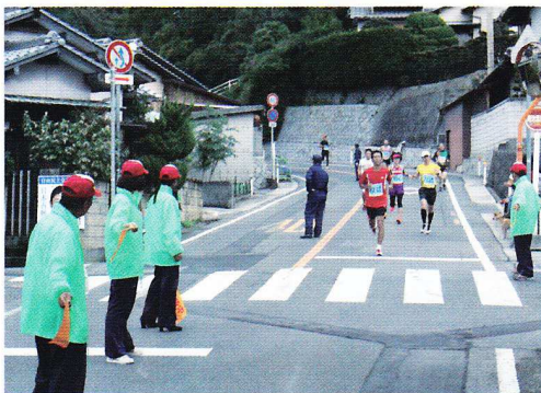
H24.10.28 高松ファミリー&クォーターマラソン in AJI

主催: 文部科学省、公益社団法人全国スポーツ推進委員連合会 主管: 第53回全国スポーツ推進委員研究協議会長崎県実行委