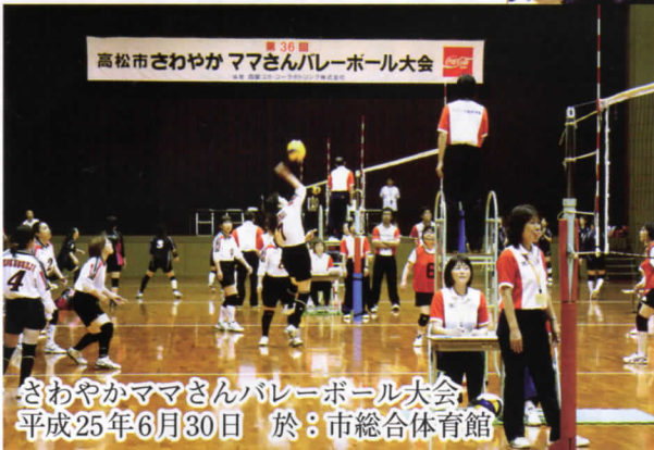
高松市さわやか ママさんバレーボール大会 平成25年6月30日 於：市総合体育館