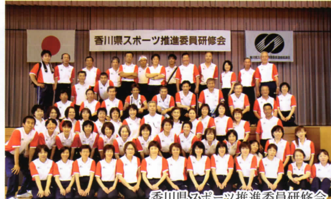
香川県スポーツ推進委員研修会 平成25年6月9日 於：香川総合体育館