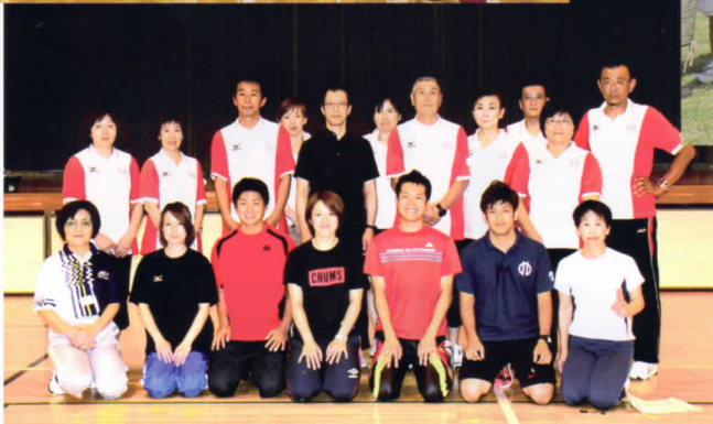
ファミリー健康体力向上事業中央講習会 平成25年8月3日・4日 於：東京都新宿区落合中学校