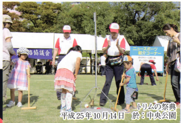
トリムの祭典 平成25年10月14日 於：中央公園