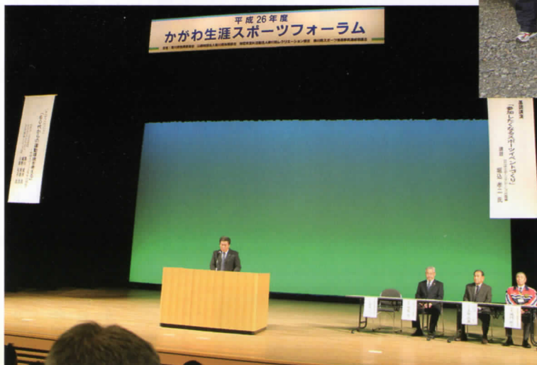
かがわ生涯スポーツフォーラム 平成26年11月29日(土) 於：三豊市文化会館 マリンウェーブ