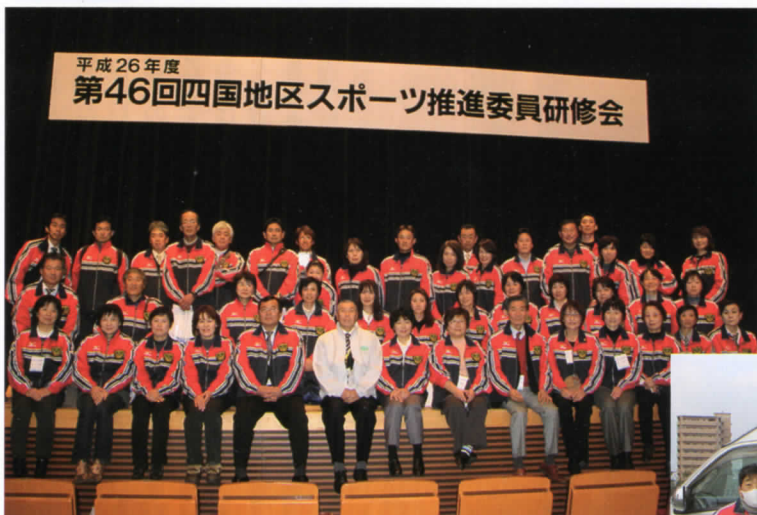
第46回四国地区スポーツ推進委員研修会 平成27年1月17日(土)・18日(日) 於：サンポートホール高松