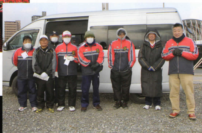
第46回四国地区スポーツ推進委員研修会 駐車場係