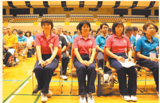
感謝状を贈呈された3人。 これからも一緒にがんばりましょう