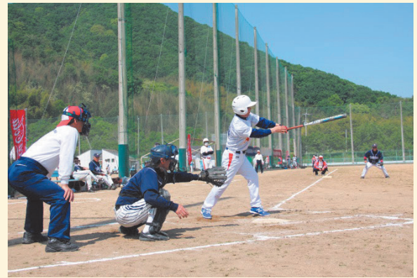
まだまだ若い、ナイスバッティング!