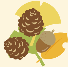
香川県スポーツ推進委員研修会 平成28年6月12日(日) 於：高松市香川総合体育館