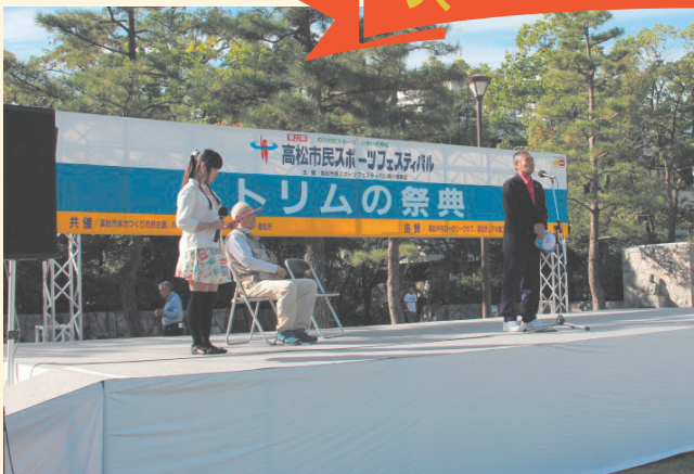
トリムの祭典 平成28年10月10日(月・祝) 於：高松市中央公園