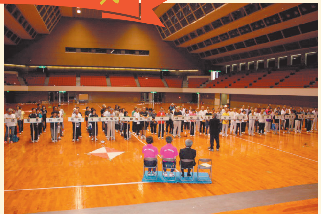
ダイヤゾーン・ボール大会 平成28年9月25日(日) 於：高松市総合体育館