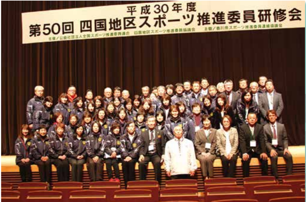
平成30年度 第50回 四国地区スポーツ推進委員研修会 主催／公財社団法人全国スポーツ推進委員連合会 四国地区スポーツ推進委員協議会 主幹／高松市スポーツ推進委員連絡協議会