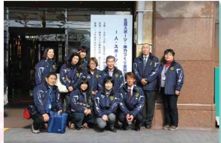
生涯スポーツ体力づくり全国大会2019 平成31年2月1日(金) 於：徳島市