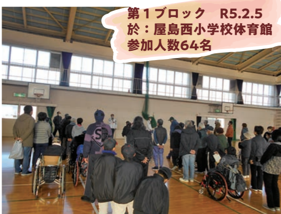
第1ブロック R5.2.5 於：屋島西小学校体育館 参加人数64名