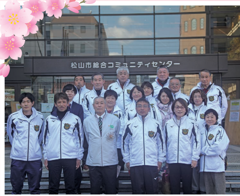
第53回四国地区スポーツ推進委員研修会 令和5年1月21日(土)・22日(日) 於：松山市総合コミュニティセンター カメラリアホール

障害のある人となない人が一緒に楽しめるプログラム作成を与えられ、パラスポーツのあり方など、もっと深く考え取り組んでいかなければと実感させられた有意義な一日でした。