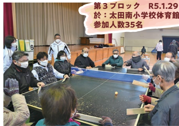
第3ブロック R5.1.29 於：太田南小学校体育館 参加人数35名