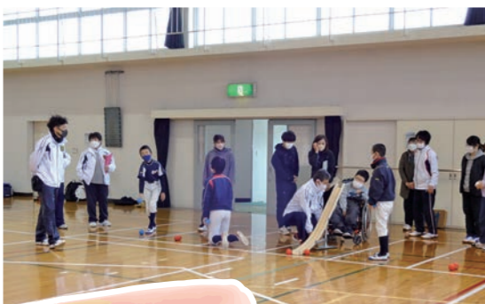
第4ブロック R4.12.11 於：川添小学校体育館 参加人数68名