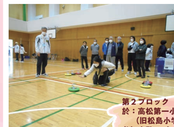
第2ブロック R5.3.19 於：高松第一小学校体育館 (旧松島小学校) 参加人数50名