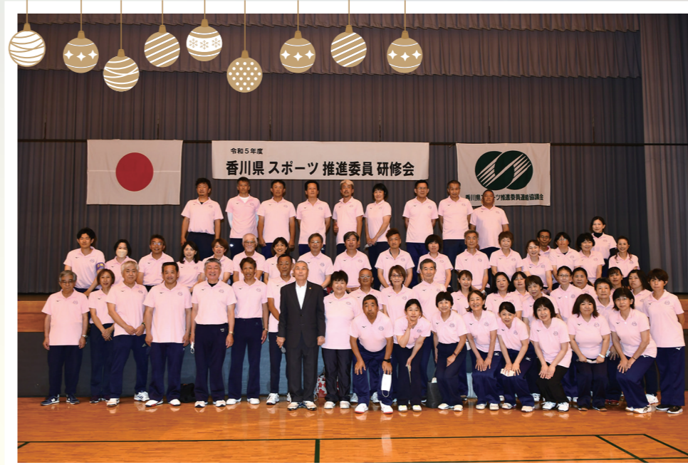
令和5年度香川県スポーツ推進委員研修会 令和5年6月18日(日) 於：香川総合体育館