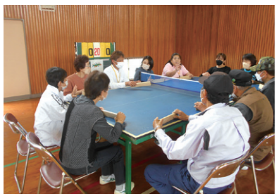
第1ブロック R5.5.14 於：庵治小学校 参加人数25名