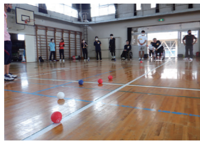
第3ブロック R5.6.25 於：鶴尾小学校 参加人数38名