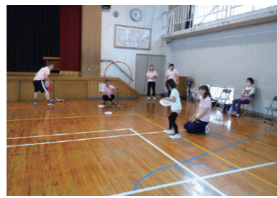
第4ブロック R5.7.9 於：三溪小学校 参加人数42名