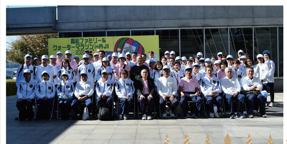
高松ファミリー&クォーターマラソン in AJI 2023 令和5年10月29日(日) 於：庵治町