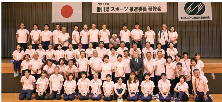
第47回 トリムの祭典