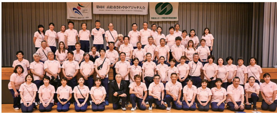
第6回 高松市さわやかアジャタ大会