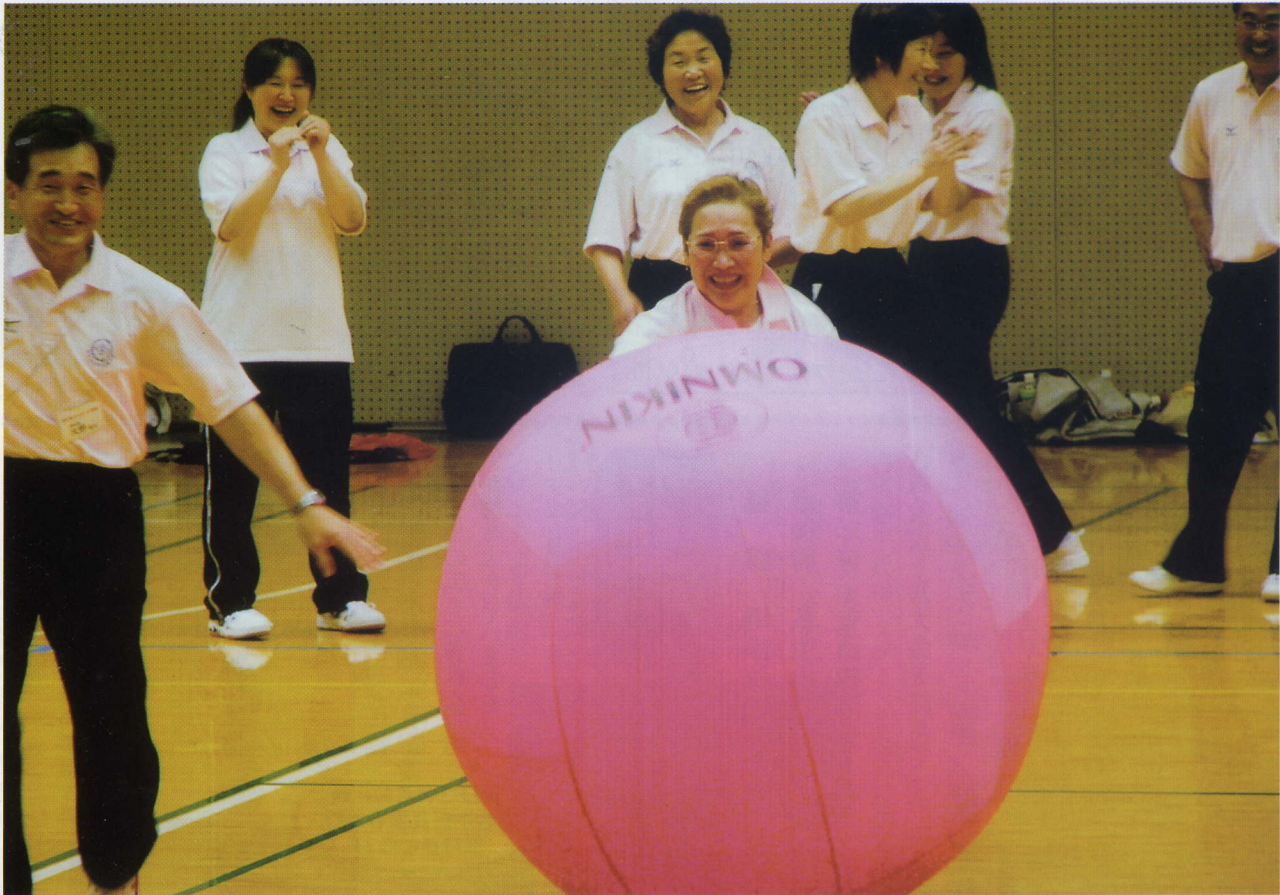
H18.5.28(日) 於:香川総合体育館